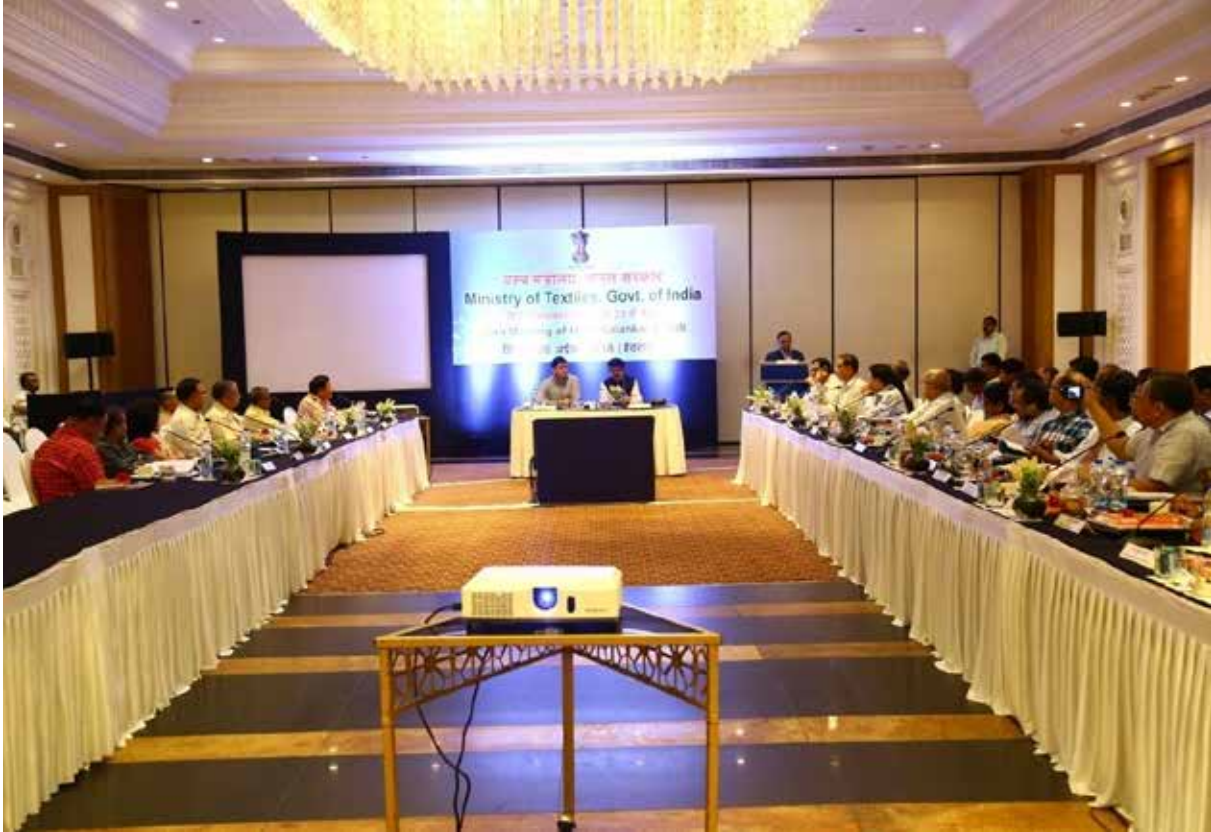
20 अप्रैल, 2018 को हैदराबाद (तेलंगाना) में संपन्न हिन्दी सलाहकार समिति की 24वीं बैठक में उपस्थित समिति के गैर-सरकारी एवं सरकारी सदस्य