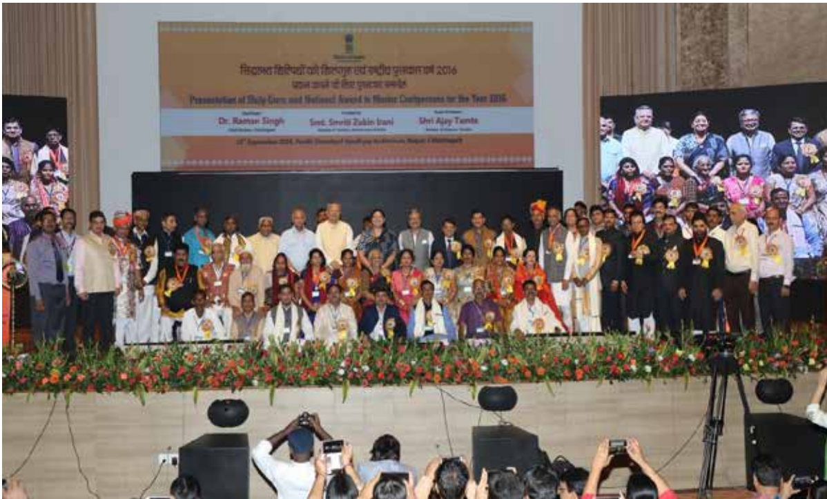
छत्तीसगढ़ के माननीय मुख्यमंत्री डॉ. रमन सिंह, माननीय वस्त्र मंत्री श्रीमती स्मृति जूबिन इरानी के साथ शिल्प गुरुओं तथा राष्ट्रीय पुरस्कार विजेताओं का सामूहिक फोटोग्राफ।